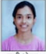
प्राची धोरात 91.05%