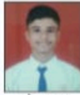
ओम कदम 95.37%