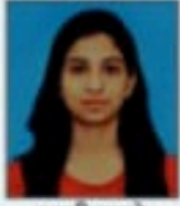
प्रगती बकरे (M) 91.50%