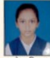
अपेक्षा निकम (E) 86.34%