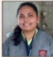
कन्याणी डोळे एम.एल.टी. 81.50 %