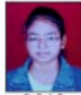
दाक्षिणी पेटीकर 95.24%