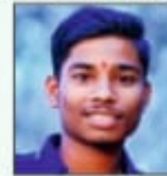
आर्वज घाडगे इलेक्ट्रिकल टेक्नॉलॉजी 64.67 %