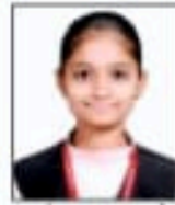
अलंकार काळभोर 90.42%