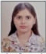
संस्कृती वाघमारे 94.08%