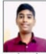
आदेश तरे 92.00%